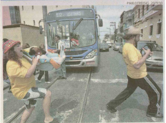
Performances nos semáforos alertam para uso do equipamento

Cubatão, Guarujá e Mongaguá já vão autuar. Bertioga, Peruíbe e Praia Grande vão conscientizar até o final do mês, começando a fiscalização em 1º de outubro